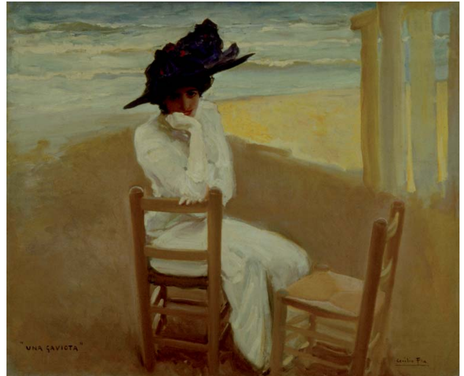
Cecilio Pla: Una Gaviota , 1910-1914

Després d'un recorregut per la mostra, en petits grups realitzarem un exercici pràctic que consistirà en treballar una sèrie de fitxes per posar en pràctica els coneixements assolits. Al final, tots els grups posaran en comú les seves respostes, tot explicant-les i, si és dóna el cas, realitzant una mena de concurs a partir de les respostes encertades o no.